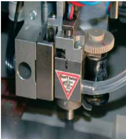
Bild 4. Kernstück der Die-Attach-Maschine ist das »Rotary Bond Tool« mit Mikrogetriebe

Getriebe ermöglicht. Diese wird benötigt, um die Halbleiterchips für den weiteren Positioniervorgang zu greifen. Die Hohlwelle ermöglicht auch die Benutzung eines optischen Sensors, um sicherzustellen, dass der Chip erfolgreich gegriffen wurde. Die Abtriebswelle wird mit vorgespanntem Kugellager gestützt, was ausreichende Führungsgenauigkeit gewährleistet.