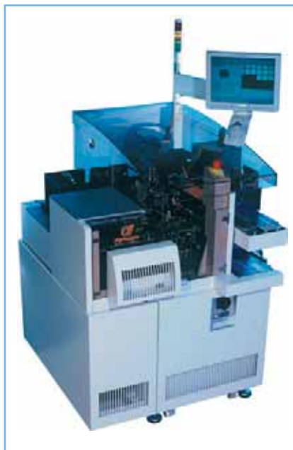
Bild 3. Eine Die-Attach-Maschine wie die »Easyline 8032« montiert Chips in ihre Gehäuse

Es wurden bereits Getriebe in diesen Miniaturabmessungen entwickelt, unter anderem auch aus Kunststoffmaterialien. Die erreichen jedoch nicht diese Genauigkeit in der Bewegungsübertragung. Anhand eines Vergleichs lässt sich die erreichbare Genauigkeit gut verdeutlichen: